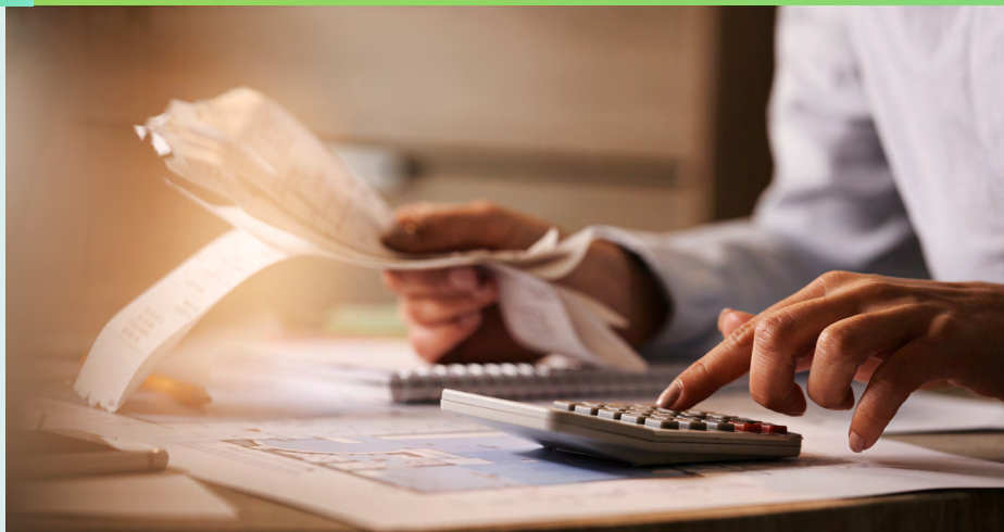
TABELA DE REEMBOLSO